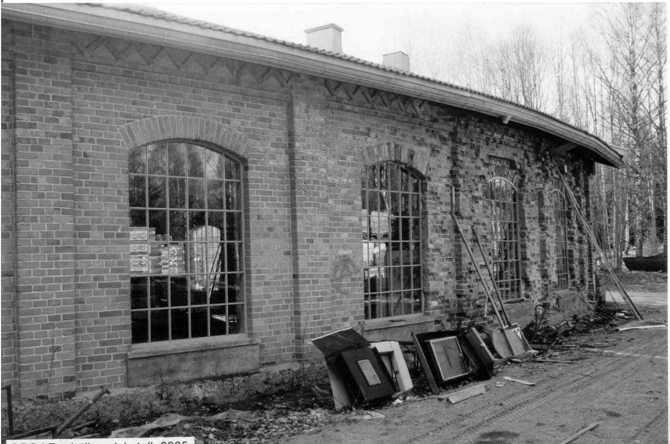
0001 - 0005 lokstall 0005